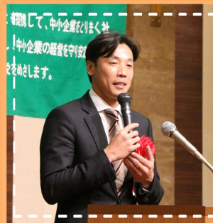
記念講演講師 鈴木 尚広氏